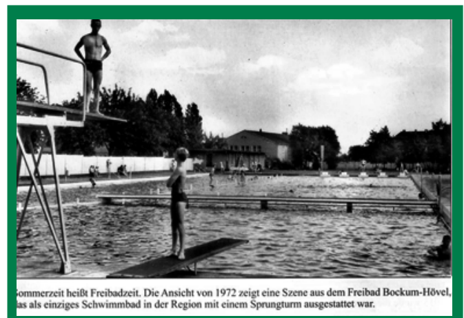
Sommerzeit heißt Freibadzeit. Die Ansicht von 1972 zeigt eine Szene aus dem Freibad Bockum-Hövel, das als einziges Schwimmbad in der Region mit einem Sprungturm ausgestattet war.

Die Redaktion wünscht Ihnen viel Spaß beim Lesen dieser Ausgabe!