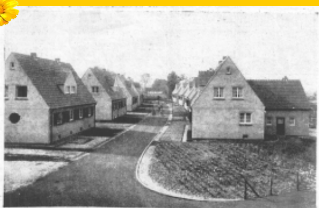
Eine hübsche Siedlung in Hamm-Norden. Die Siedlung der Hammer Gemeinnützigen Baugesellschaft am Culmer Weg, die zur einzigen Zeit fertiggestellt wurde.