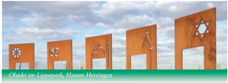
Objekt im Lippepark, Hamm Herringen