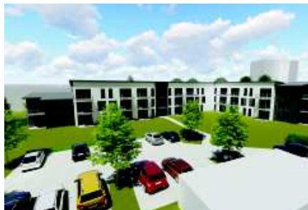
(© Dirk Rost Architekturbüro)