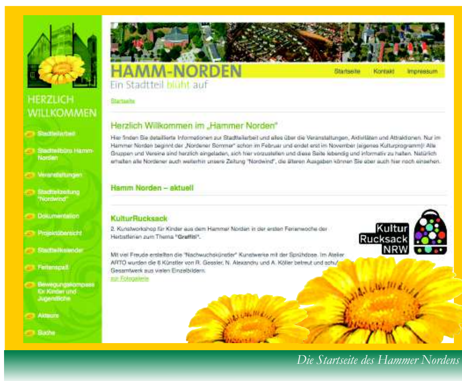
Die Startseite des Hammer Nordens

allen Veranstaltungen in Galerien des Beitrages zur Verfügung gestellt.